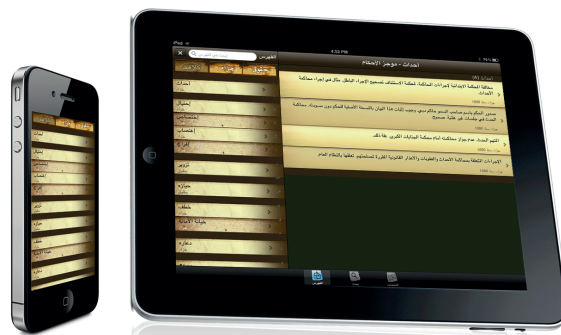
تطبيقات الهواتف الذكية

يتيح نظام خدمات تقنية المعلومات لموظفي المحاكم إمكانية الإبلاغ عن الأعطال التقنية المتعلقة بالحاسب الآلي والبرامج الإلكترونية. كما يوفر النظام إمكانية متابعة حل المشاكل بالتنسيق مع قسم المساندة في إدارة تقنية المعلومات، ويساهم هذا النظام في وضع جدول الأولويات في حل المشكلات التقنية في أروقة المحاكم مما يساهم في تسريع حل الأعطال الرئيسية وخاصة المرتبطة بالمتعاملين الخارجيين.