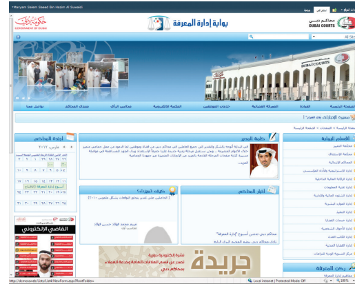
بوابة إدارة المعرفة الإلكترونية

وتضم البوابة باباً للتشريعات والمبادئ القانونية والتي تعد أحد أهم مصادر المعرفة القانونية وأكثرها تداولاً في المحاكم، بالإضافة إلى باب القيادة والذي تشمل كل القرارات ومحاضر الاجتماع الخاصة بالقيادة العليا في محاكم دبي بالإضافة إلى باب خدمات الموظفين والذي يشمل عدداً من الخدمات التي تقدمها الوحدات التنظيمية لموظفي المحاكم، قائمة خاصة بالأرقام المباشرة للعاملين بالمحاكم وذلك لاختصار عملية البحث عن هذه الأرقام والوصول إلى أصحابها بسهولة ويسر.