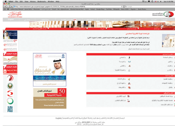
الموقع الرسمي لمحاكم دبي