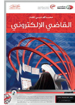
نظام القضايا الإلكتروني

إدارة الأداء الإلكتروني. وتعد هذه الأنظمة والخدمات الإلكترونية - بالنسبة لكل قاضٍ في محاكم دبي - بيئة معرفية إلكترونية إلى جانب كونها بيئة لإنجاز الأعمال والمهام القضائية. فهذه الأنظمة والخدمات تساعد على الوصول إلى المعلومات والبيانات إلى جانب أحكام المحاكم والقضاة الحالية والسابقة. وهذه الأخيرة تعد مخزوناً معرفياً ثرياً يتم الرجوع إليها والاستفادة منها بشكل روتيني.